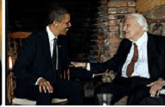
Billy Graham avec les présidents: D. Eisenhower, R. Nixon, G. Ford, R. Reagan, B. Clinton, B. Obama

Plus d'un chrétien sincère à la base de la Pyramide pense donc que la prospérité de l'évangélisme est la « bénédiction » de Dieu ou du Christ. Mais en réalité c'est plus compliqué que cela, c'est vrai que c'est Dieu qui dirige tout, mais non sans respecter aussi le libre-arbitre des humains.