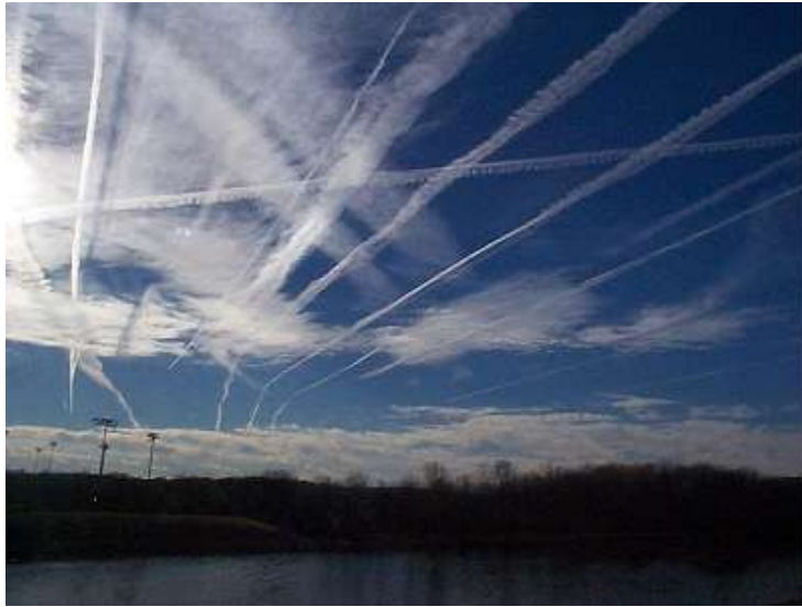
Chemtrails et géo-ingénierie du Diable

Commencez à vous renseigner sur les réalités comme par exemple HAARP, les armes électromagnétiques, les chemtrails, les effets des expériences au CERN, etc..