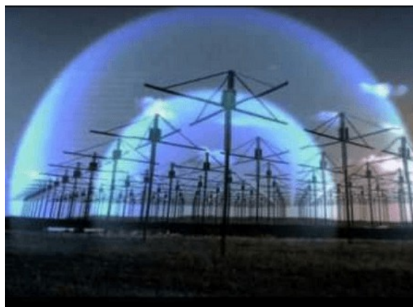
La « H.A.A.R.P » du Diable...

Beaucoup de ces phénomènes de nos jours, en ces temps de la fin, sont donc le plus souvent dus à des armes secrètes et à des technologies diaboliques secrètes. C'est l'accomplissement de la Parole de Dieu et de notre Seigneur Jésus Christ, donc c'est le miracle de Dieu, mais pas au sens que vous croyez.