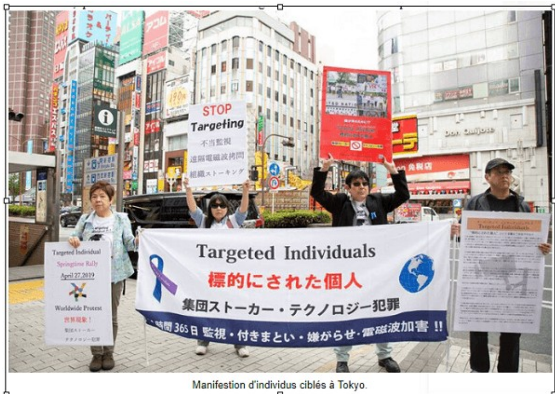
Manifestation des «Targeted individuels» ou «Individus ciblés» à Tokyo au Japon.

A Tokyo au Japon (et soit dit en passant les autorités japonaises sortent aussi la vérité sur le crime contre l'humanité qu'est le Covid):