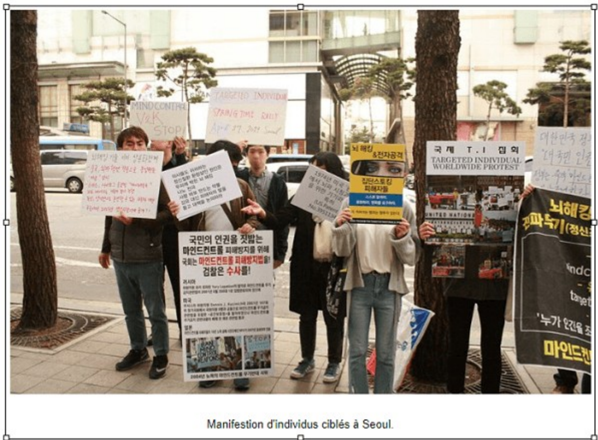
Manifestation d'individus ciblés à Seoul.

Inutile de mettre mille images, car on convaincra les gens ignorant un problème (et c'est le but justement des manifestations de plus en plus nombreuses), pas ceux qui manifestement connaissent le problème et même sont très probablement coupables, et qui s'emploient à NIER. Il y a des manifestations en France et en Europe aussi, mais comme pour le Covid, la guerre en Ukraine etc., c'est le MENSONGE effroyable des médias.